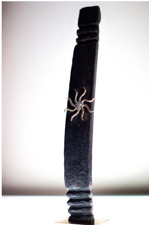
Trophée « European Iter Vitis France »

Une première en Europe, « Iter Vitis France » a organisé la sélection nationale des candidats au concours « European Iter Vitis Awards » qui a pour objectif de mettre en lumière les vignobles et l'action locale de chaque pays membre de l'itinéraire culturel du Conseil de l'Europe.