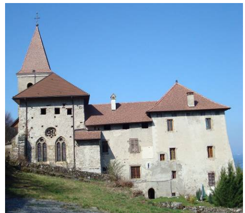
Prieuré de Meillerie en Haute-Savoie

Elle envisage de consacrer de futurs tomes à d'autres sites savoyards comme le Prieuré de Saint-Paul ou l'Abbaye d'Abondance.